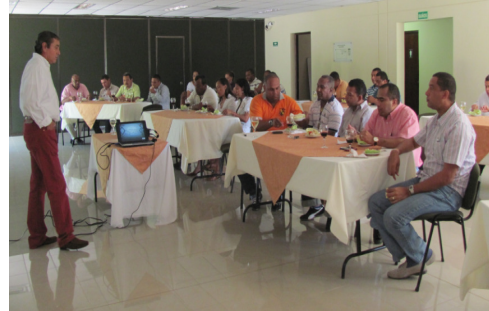
Salón Calaguala - LMN

(Corpoguajira, Alcaldía de Albania, las Divisiones Ingeniería y Proyectos, Departamento Legal y Comunicaciones de Cerrejón) que han apoyado el desarrollo del proyecto Hotelero.