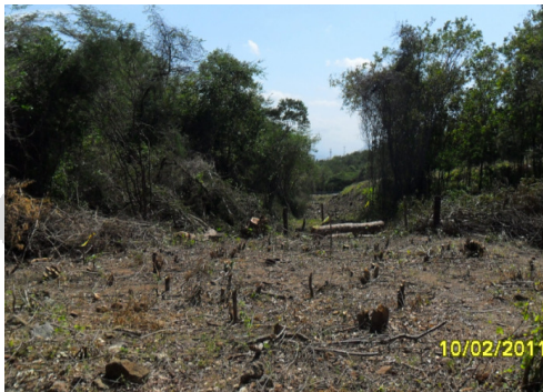
Lote Campo Herrera