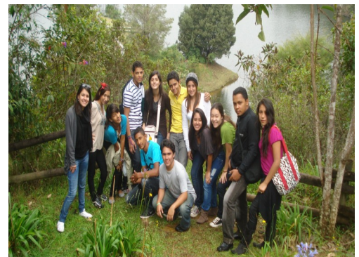
Ganadores del concurso de ensayo corto en el Parque Arvi, Medellín. Mayo 22 de 2011.

También conocieron sobre los Concejos Municipales de Juventud (CMJ), espacio donde se promueve una cultura de participación, compromiso y movilización de los jóvenes alrededor de los temas que los afectan.