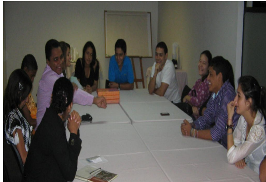
Mesa de conclusiones sobre las iniciativas visitadas y aportes de la experiencia en Medellín. Hotel Plaza Rosa, Mayo 22 de 2011

Esta iniciativa fue auspiciada por la Fundación, Gestión Social de Cerrejón y Comfaguajira.