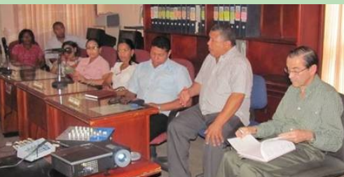
Recinto Concejo municipal de Fonseca – Lanzamiento proyecto de modernización.

Con el acompañamiento de la Fundación, y el cofinanciamiento de la Fundación Ford, el municipio de Fonseca inició el proceso de modernización institucional de su administración, con el que se espera, en el término de un año, ayudar a fortalecer sus esquemas de gestión territorial y mejorar su eficiencia y eficacia en la ejecución de proyectos, todo ello en beneficio de la comunidad y familias de más bajos ingresos.