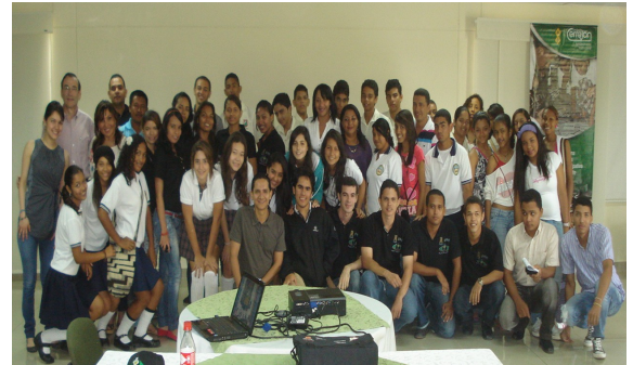
Participantes del evento de cierre del proyecto “Construcción de Cuentos Digitales”: los cinco grupos finalistas del concurso de ensayo corto “Jóvenes por el Futuro de las Regalías 2010”, miembros del Grupo Motivar, representantes de la Fundación y la División de Gestión Social de Cerrejón.

Próximamente, los cuentos serán publicados en la página Web de la Fundación.