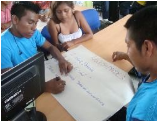
Taller sobre SGP y regalías en Cerrejón 1, Resguardo 4 de Noviembre, Albania. 24 de mayo, 2011.

Estas actividades hacen parte de una serie de tres talleres que recibirá cada comunidad sobre los temas de Estado, mecanismos de participación y control ciudadano, y funcionamiento del sistema de regalías y sistema general de participaciones. Posteriormente, contarán con la asesoría técnica para adelantar un ejercicio de veeduría a un proyecto prioritario que identifique la comunidad. Esta corresponde a la fase inicial del proyecto, con el que se pretende acompañar a las comunidades en la vigilancia de la inversión de recursos públicos en su beneficio, al tiempo que se pretende fomentar la participación activa y calificada de las comunidades indígenas en torno a los asuntos públicos.