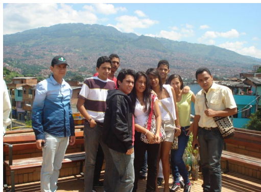
Ganadores del concurso de ensayo corto “Jóvenes por el Futuro de las Regalías” en la comunidad de Moravia, Medellín. Mayo 21 de 2011.

Moravia fue uno de los lugares visitados, por los estudiantes y docentes del colegio Madre Bernarda Bütler de Barrancas y del Colegio Albania, donde fueron testigos de cómo con la intervención directa del Estado y la sociedad civil se