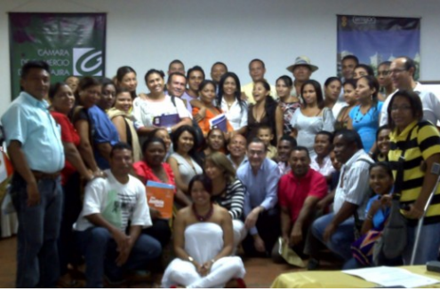
Participantes del último módulo del diplomado Conciliación en Equidad. Centro de convenciones Anas Maí, Riohacha, 28 de mayo de 2011.

De otro lado, el 28 de mayo en el Centro de Convenciones Anas Maí en Riohacha, se llevó a cabo el último módulo del primer Diplomado de Conciliación en Equidad en La Guajira: “Articulación con otras figuras” y “Escenario sostenible para la conciliación en equidad”. Esta actividad ha sido promovida y auspiciada por la Fundación.