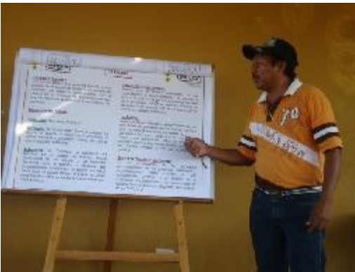
Taller sobre el Estado en la comunidad de Rio de Janeiro, Resguardo 4 de Noviembre, Albania. 4 de mayo, 2011.

E n el marco de las actividades previstas en el proyecto de apoyo al desarrollo sostenible y control ciudadano con cinco comunidades del área de influencia de la vía férrea de Cerrejón, los días 4, 24 y 27 de mayo el equipo de la Fundación y Gestión Social de Cerrejón realizó actividades de capacitación con las comunidades indígenas de Uribia y Albania participantes en el proyecto.