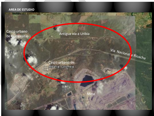
Área de estudio para la modificación del EOT

La firma PINILLA GONZALEZ & PRIETO realizó los ajustes solicitados por CORPOGUAJIRA y el 26 de Octubre entregó este documento al Municipio de Albania para su respectiva aprobación en el Concejo. Se espera que en la primera semana de Noviembre/10 este autorizado el EOT parcial por parte del Municipio.