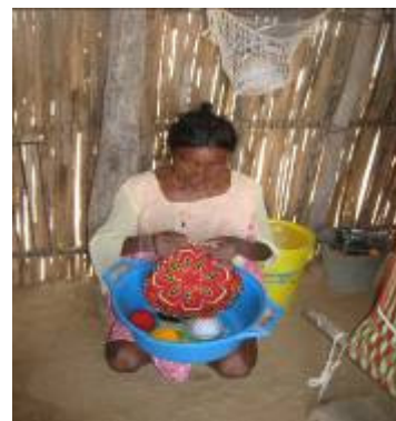
Mujer tejiendo una mochila

Se hizo seguimiento a la rentabilidad que están llevando las familias con el proyecto productivo, el cual es adecuado y provechoso.