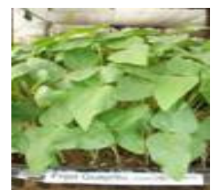
Plantulacion en Turba.