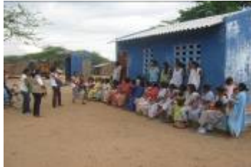
Concertación de proyecto productivo

Se hizo supervisión y seguimiento por funcionarios del I.C.B.F sobre el desarrollo del programa en las comunidades de Manzana, obteniendo unos resultados óptimos en su funcionamiento.