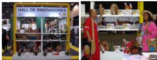
Stan de los Talleres Jeketuü y Kannas en la IV Exhibición Internacional de Cuero e Insumos, Maquinaria y Tecnología -EICI

Participación de Artesanos en el XXIV Festival de la Cultura Wayuu.