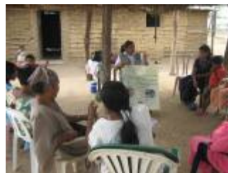
Taller en Valores Humanos

De igual forma se capacitó por medio de talleres en las comunidades de Apunimana 1, Los Cerritos, Okushimana, Manzana, y la Villa a 110 familias en el tema de “La familia y los valores humanos”.