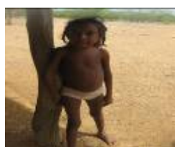
Niña de 9 años

Como plan de mejoramiento estos niños entrarán a un proceso de recuperación nutricional el cual será supervisado directamente por una nutricionista.