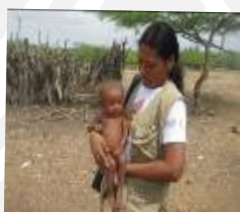
Niña de 14 meses

En la supervisión que se les realizaron a las familias de esta comunidad que ingresaron en el mes de mayo se encontró 4 menores desnutridos que oscilan entre las edades de 1 a 9 años.