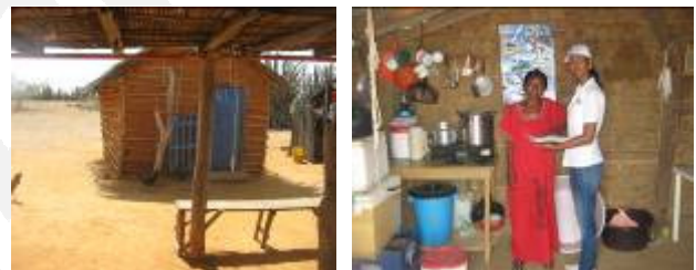
Viviendas organizadas y limpias

En las comunidades de Karinamana, Morrenaka y Witka se llevaron a cabo 15 visitas, donde se analizó el estado de las familias y el cumplimiento de los lineamientos del programa, se observó que cumplen y ponen en práctica los procesos y capacitaciones, arrojando muy buenos resultados reflejados en su estilo de vida. Se encontraron viviendas aseadas y organizadas, entorno limpio, aguas y alimentos bien conservados, niños en buen estado de salud.