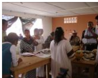
Visita funcionarios y alumnos del Sena a los Talleres Juwaa Y Jeketuu (Granja Experimental).

En días anteriores funcionarios del Sena sur y beneficiarias del Convenio que se adelanta con CREATA en los resguardos del sur de la Guajira visitaron los talleres Jeketuu y Juwaa, para observar de primera mano el proceso de producción de estos talleres, con el objetivo de montar talleres y trabajar con materias primas como el cacho y el cuero de ganado vacuno y caprino. Siendo estos unos de los grandes atractivos y temas innovadores en el mercado artesanal.