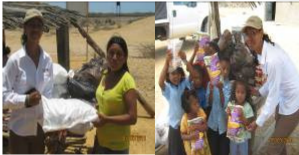
Entrega de paquetes alimentarios más suplemento alimenticio "Bienestarina"

Se realizó la entrega de paquetes alimentarios en las comunidades ubicadas en la Zona de Media Luna y Línea Férrea, ampliando en este mes de Mayo siete nuevas familias en la comunidad de Karinamana Km. 124 vía al Cabo de la Vela, dado al grado de desnutrición encontrado en algunos menores de la comunidad. Entregándose un total de 207 paquetes de alimentos distribuidos en las 19 comunidades beneficiarias.