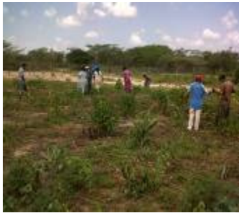
Adecuación de yujas