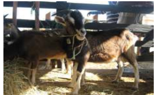
Reproductor raza Toggenburg

Para comenzar con el mejoramiento genético de los caprinos de La Granja buscando obtener una mejor producción de leche y calidad de carne, se adquirieron cinco reproductores, de las siguientes razas: la Mancha, Toggenburg, Alpino Francés y Alpino Americano.