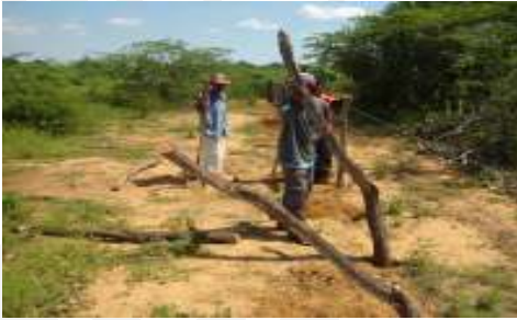
Reconstrucción de Yujas en nuevas parcelas