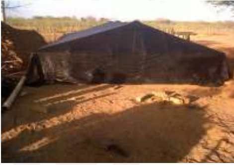
Reservorio con protección y sombrío de polisombra.

Así mismo se están realizando trabajos de cerramiento con cardón alrededor del reservorio para su protección y sombrío de árboles nativos.