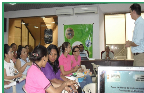
Taller de sensibilización sobre conciliación en equidad en Barrancas, 9 de septiembre de 2010

conciliadores y adquirir este importante compromiso con sus comunidades.