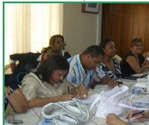
Capacitación Funcionarios Hatonuevo, 1 septiembre

Esta capacitación hace parte del proyecto de modernización que viene impulsando la Fundación en el municipio de Hatonuevo.