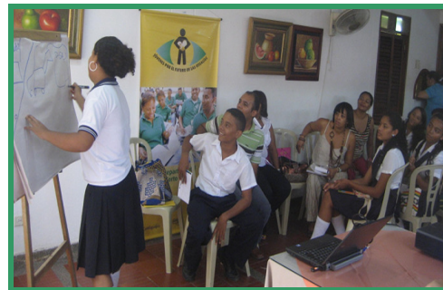
Jóvenes y docentes de Barrancas y Hatonuevo juegan al “Pictionary de las Regalías”

El programa Jóvenes por el futuro de las regalías se está ejecutando entre la Fundación, Comfaguajira y el área de Gestión Social de Cerrejón. Los talleres de septiembre se llevaron a cabo en virtud de un convenio entre la Fundación y la Corporación Ocaso, y fueron evaluados con un promedio de 4.8 sobre 5 por los estudiantes y docentes.