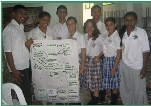
Jóvenes y docentes de Albania y Uribe crearon mapas para mostrar el flujo de las regalías

En sesión intensiva de 5 horas se trataron temas de geopolítica, minería y desarrollo, y el esquema de regalías en Colombia. Los jóvenes entre 14 y 18 años y sus docentes propusieron soluciones para que sus comunidades se desarrollen de manera sostenible, aprovechando los ingresos de regalías del departamento y los municipios.