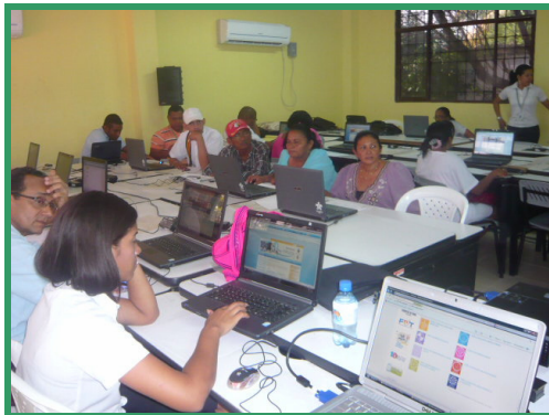
Tercer Taller “Internet para la Rendición de Cuentas – Módulo Regalías”, 16 de septiembre.

Con este proyecto piloto, la Fundación y Transparencia por Colombia buscan mejorar las condiciones de acceso a la información pública, especialmente sobre regalías, en beneficio de la participación ciudadana y el ejercicio del control social a las regalías en estas cuatro localidades.