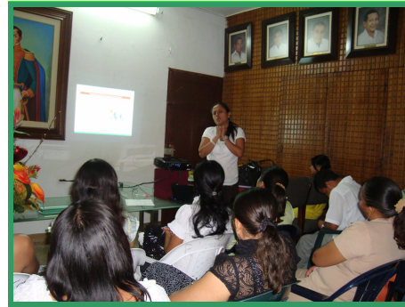
Alcaldía de Hatonuevo

meta la conformación de 6 grupos de control social, de los cuales 3 serán integrados por jóvenes.