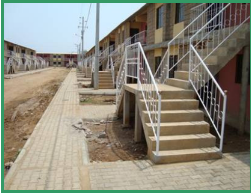
Proyecto de 300 viviendas de interés social en Albania