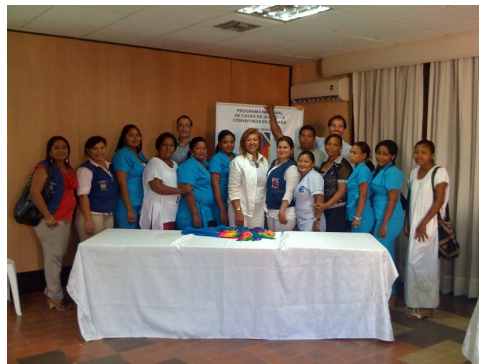
La Directora de Acceso a la justicia del Ministerio con funcionarios de la Fundación y de la Casa de Justicia de Riohacha. 21 de octubre.

La reunión también constituyó una oportunidad para que los futuros funcionarios de la Casa de Justicia Regional conozcan a sus homólogos de los municipios aledaños y se informen sobre los beneficios que la Casa proveerá para los ciudadanos de los tres municipios.