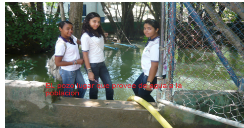
Estudiantes investigadores de regalías.

Los ensayos serán evaluados por un jurado compuesto por un periodista y funcionario público de la región, y un académico experto en el tema de regalías y participación ciudadana. Los cinco equipos finalistas realizarán una sustentación oral de sus ensayos el 18 de noviembre.