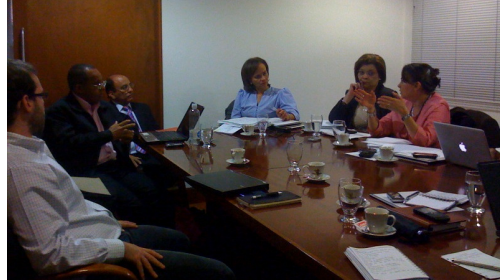
El Gobernador, el Secretario de Educación Departamental, y la Secretaria General del Ministerio se reúnen con funcionarios del Ministerio y la Fundación, 26 de octubre.

La propuesta de la estructura organizacional fue validada por el Ministerio en primera instancia; en la mencionada reunión, se establecieron pasos a seguir para que la Secretaría presente el estudio al Ministerio para su aprobación formal.