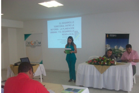
Evento Planeación Territorial Riohacha, 7 de octubre.

El seminario tuvo lugar en el Centro Cultural de Riohacha los días 7 y 8 de octubre, y congregó a funcionarios y Concejales de los municipios de Riohacha, Uribia, Manaure, Maicao, Distracción, Hatonuevo, Barrancas, Albania, La Jagua del Pilar y Fonseca.