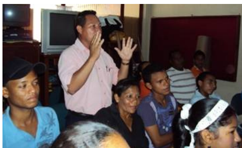
Reunión de presentación de metodología de control social. Biblioteca municipal – Municipio de Albania

Durante dicha presentación se logró la conformación de 6 grupos que ejercerán control; 3 se componen por jóvenes, 2 por líderes comunitarios, y 1 por indígenas.