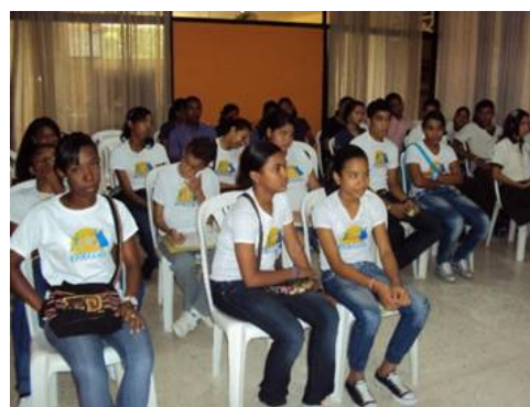
Reunión de definición comunitaria de proyectos de control social. Hotel Iparú – Municipio de Barrancas

Con esta selección de los proyectos de control social definidos por las propias comunidades, se da inicio a un ejercicio de participación ciudadana plural y responsable en los municipios cubiertos por el proyecto de la Fundación.