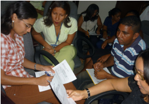
Funcionarios Alcaldía de Hatonuevo en evento de gestión del riesgo.

Esta capacitación hace parte del proyecto de modernización que viene impulsando la Fundación en el municipio de Hatonuevo, con el que se pretende promover un adecuado uso de los recursos públicos a través del mejoramiento de sus esquemas de gestión.