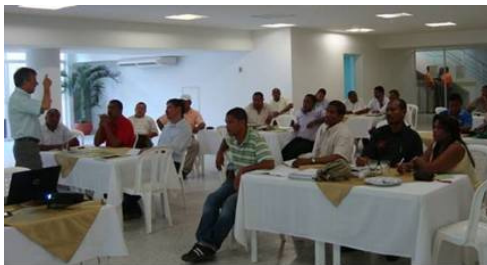
Asistentes al Seminario de Planeación Territorial, Centro Cultural de Riohacha.

El seminario tuvo lugar en el Centro Cultural de Riohacha los días 7 y 8 de octubre, y congregó a funcionarios y Concejales de los municipios de Riohacha, Uribia, Manaure, Maicao, Distracción, Hatonuevo, Barrancas, Albania, La Jagua del Pilar y Fonseca.