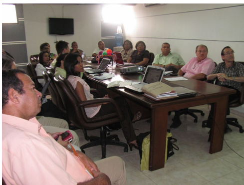
Reunión de conciliación en equidad en Cámara de Comercio de La Guajira, 7 de octubre