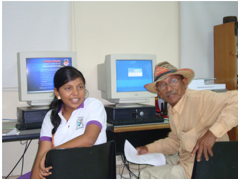
Taller en el Colegio Albania- La Mina, sobre el proyecto "Internet para la Rendición de Cuentas-Modulo de Regalías", 15 de julio.

Institucional de la Guajira y Transparencia por Colombia buscan mejorar las condiciones de transparencia y acceso a la información pública, especialmente sobre regalías, que permita a su vez contar con mejores condiciones para la participación ciudadana y el ejercicio del control social a las regalías en Albania, Hatonuevo, Barrancas y Uribia.