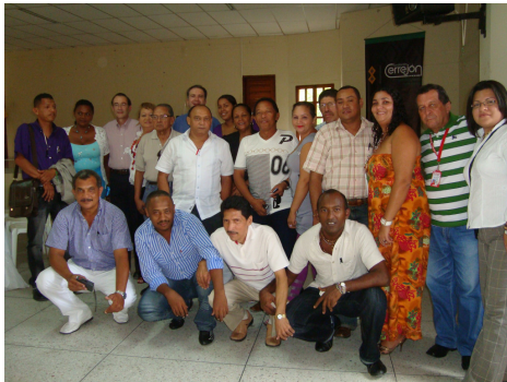
Taller de capacitación de periodistas en la CREM de Fonseca, 23 de julio.