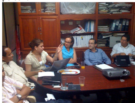
Reunión Secretaria de Educación, 6 de Julio.

Se discutieron los desafíos que ha enfrentado este proceso de modernización y se definieron pasos a seguir para lograr la racionalización de gastos administrativos de la entidad, con miras a facilitar la financiación de la nueva planta y la puesta en funcionamiento del Manual de personal.