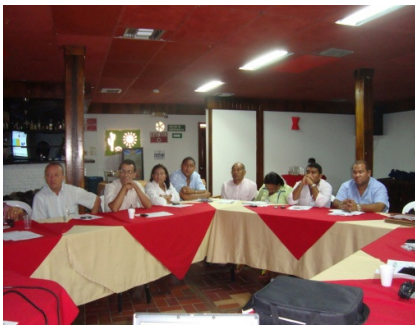
Consejo de Gobierno ampliado Municipio de Hatonuevo (Salón Taberna – Club Corpoalbania La Mina), 13 de julio.