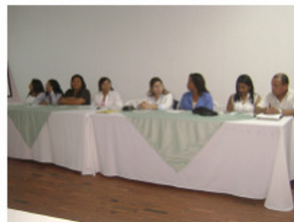
Funcionarios de la Casa de Justicia y de la Gobernación de la Guajira