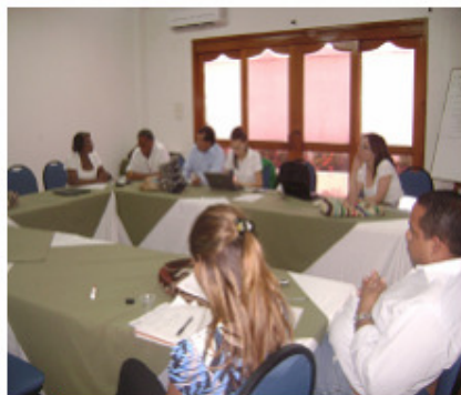
Evento Asociación Guajira de Profesionales

implementar la estrategia acordada de fortalecimiento. Este proyecto de acompañamiento a la AGP tendrá una duración aproximada de cuatro meses, durante los cuales la Asociación contará con el respaldo técnico y financiero del Consorcio y de la Fundación.