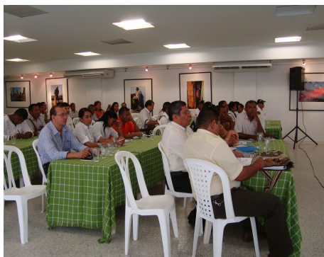
Foro Plan Departamental Agua

Como resultado del evento la Gerencia Técnica del Proyecto y la gobernación acordaron crear una página web para divulgar los avances en la ejecución del Plan. Así mismo, se acordó establecer mecanismos de comunicación que permitan mantener informados a todos los actores a través de medios masivos de comunicación locales. Se propuso la apertura de una oficina de información en cada uno de los municipios beneficiarios del Plan. Finalmente, la Gerencia Técnica acordó realizar en junio otro encuentro de rendición de cuentas.