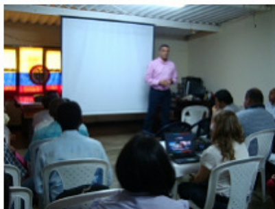
Evento de lanzamiento al proyecto "Modernización Municipio de Hatonuevo"

Con posterioridad a este lanzamiento se realizó el 17 de marzo una visita técnica a la Alcaldía de Hatonuevo con funcionarios de la Fundación MSI y de la Fundación, con el propósito de complementar el diagnóstico e identificar prioridades de intervención en la modernización. Para ello, se realizaron entrevistas a los secretarios de Hacienda, Salud, Educación y Gobierno. Así mismo se entrevistaron los jefes de las oficinas de Control Interno, Jurídica y Banco de Proyectos, todo ello con el propósito de conocer en más detalle los niveles de eficiencia y eficacia de los principales procesos administrativos a su cargo.