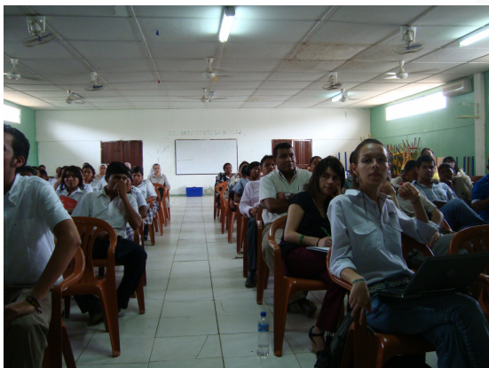
Auditoria visible a la obra "Modernización de la I.E. Normal Superior Indígena en el Municipio de Uribia".