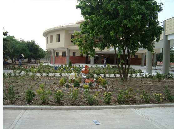
Estado de la obra “Ampliación y remodelación de la I.E. Pablo VI”

Por último, la Secretaria de Educación de Barrancas anunció a la comunidad que ya está en curso el proceso de dotación de la Institución, el cual se ha venido coordinando con los directivos de la misma y cuenta con presupuesto para el efecto.