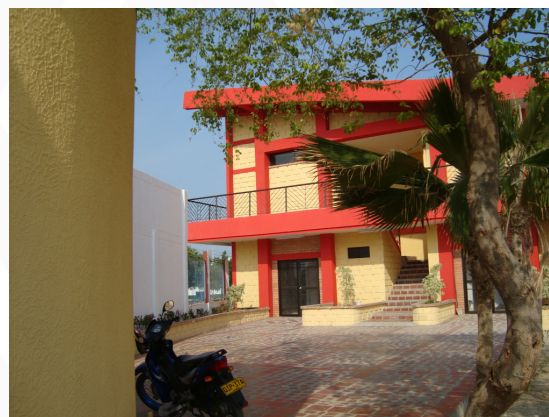
Estado de la obra "Mantenimiento, adecuación y ampliación de la I.E. Alfonso López Pumarejo en el municipio de Uribia".

Como parte de los compromisos finales que asumió la Alcaldía se encuentra la instalación en los próximos días de una cubierta para la cancha deportiva y seguir gestionando ante la Gobernación la construcción de unas obras que permitan la reubicación del matadero caprino a la entrada de la I.E., aspecto que ha sido una solicitud reiterada para garantizar condiciones de higiene y seguridad a los estudiantes de esta I.E.