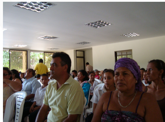
Auditoria visible a la obra “Ampliación y remodelación de la I.E. Pablo VI”