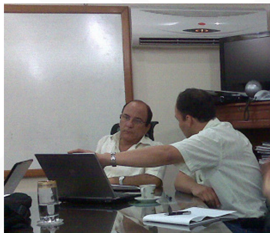
Reunión Gobernador Departamento con funcionarios MEN, Cerrejón y Fundación

Cerrejón y la Fundación continuarán asesorando el proceso de modernización de la SED hasta lograr la finalización de esta etapa de fortalecimiento institucional, con la aprobación de su planta de personal y funciones respectivas.