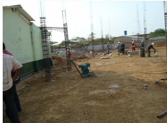
Estado de la obra “Modernización de la I.E. Normal Superior Indígena en el Municipio de Uribia”.

Por otro lado, la Secretaria de Obras solicitó al contratista que aunque la fecha de terminación de esta obra está proyectada para el 24 de octubre de 2010, se debe realizar un esfuerzo adicional para lograr terminarla en un plazo inferior.