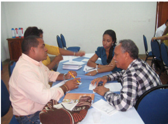
Grupos de trabajo de la AGP, Taller Riohacha, 18 de febrero 2010