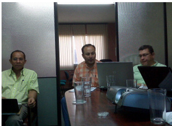
Secretario Educación del Departamento y funcionarios MEN, Riohacha, 4 febrero