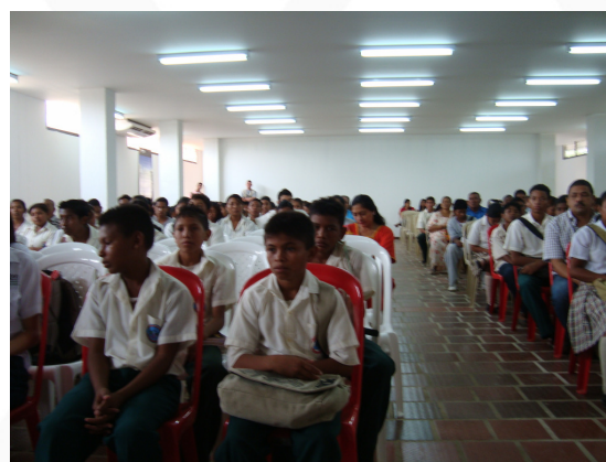
Auditoria visible a la obra "Mantenimiento, adecuación y ampliación de la I.E. Alfonso López Pumarejo en el municipio de Uribia".