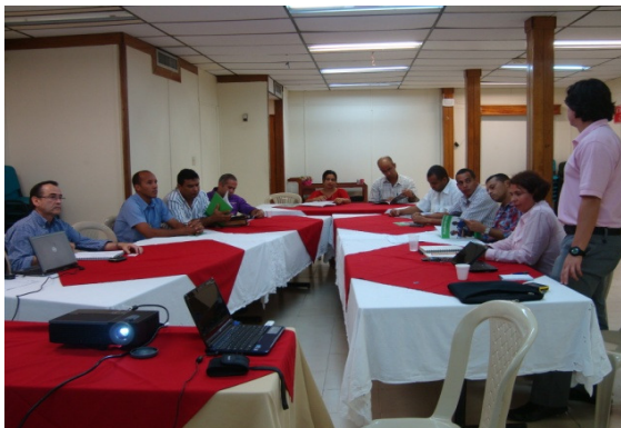
Evento Internet para la Rendición de Cuentas. Corpoalbania - La Mina

herramienta informática y definir su aporte en el desarrollo del proyecto.