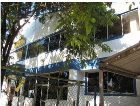
Casa de Justicia, Riohacha, en remodelación

En la reunión, que se llevó a cabo en las oficinas del Ministerio de Interior y Justicia en Bogotá, se identificaron los obstáculos que ha enfrentado el proyecto y la necesidad de tomar acciones para concretar la reciente decisión anunciada por USAID de invertir US$ 95.000 dólares en la primera etapa de la remodelación de la Casa.