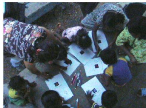
Conservación de Recursos - Malla Sur